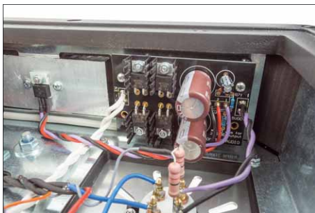
Die Kabelführung im Inneren ist sehr aufgeräumt. Alle Spannungen werden sauber gefiltert