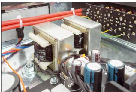
Statt einer RC-Filterung hat man sich an vielen Stellen für die aufwendigere (und teurere) LC-Filterung entschieden

struierten „Ephedra“, einer Kombination aus einem 12-Zoll-PA-Treiber und einem Hochtonhorn konnten wir dann auch mal die Wände wackeln lassen, so dass alle Kollegen im Verlagsgebäude etwas davon hatten. Im Bass reicht das immer noch nicht ganz an die Transistorkollegen mit ordentlich Gegenkopplung heran, ist aber potent genug, um auch mal den einen oder anderen gemeinen Tritt auf das Pedal der Bassdrum in die Magengrube fahren zu lassen. Und die grollenden Kontrabässe eines ganz großen Symphonieorchesters, bei der Peer-Gynt-Suite oder der Ouvertüre zum Fliegenden Holländer, haben Autorität und Schwärze. Die wahre Stärke des Evolution One offenbart sich aber etwas weiter oben im hörbaren Bereich: Stimmen, Naturinstrumente und ihre Obertöne gibt die Kombination so leidenschaftlich, offen und lebendig wieder, dass man sich ganz nahe dran am Livekonzert fühlt. Die räumliche Abbildung ist dabei höchst organisch – die Raumaufteilung ist weit und tief, dabei klar nachvollziehbar und exakt, vielleicht ohne das letzte Quäntchen Kantenschärfe, das Verstärker anderer Bauart zu liefern imstande sind. In Sachen Charme und Farbenpracht muss sich der Trafomatic vor keinem anderen verstecken.